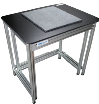
Table Anti-Vibration TAV La TAV fournit une surface solide et stable développée spécifiquement pour aider à réduire les vibrations pendant les mesures. la table permet à la balance de fonctionner avec une précision considérable malgré les courants d'air ou les mouvements qui pourraient causer des fluctuations dans les lectures.